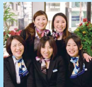
開発プロジェクトチーム

おかげさまで今年オープンした各温泉スタンドは毎月ご利用者の方が増えて来ております。ちなみに粋透水とは、博多弁で女性が言う「好(す)いとう」が語源です。今後とも安心・安全な粋透水をお届けして皆様の健康のお役に立てればとスタッフ一同全力で取り組む所存です。